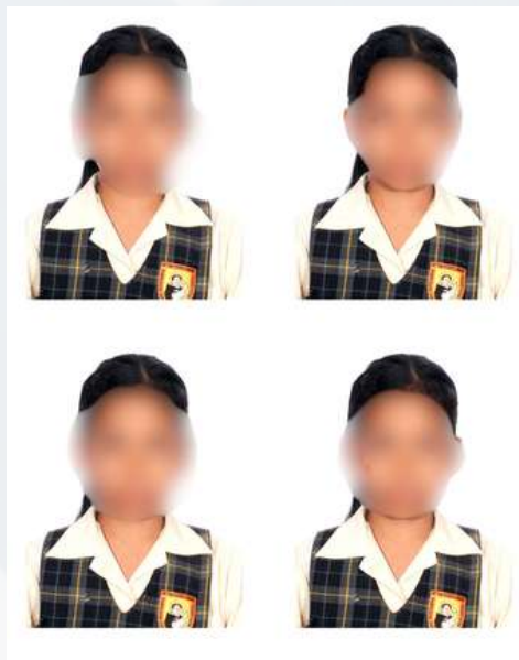
4 fotos tamaño carnet