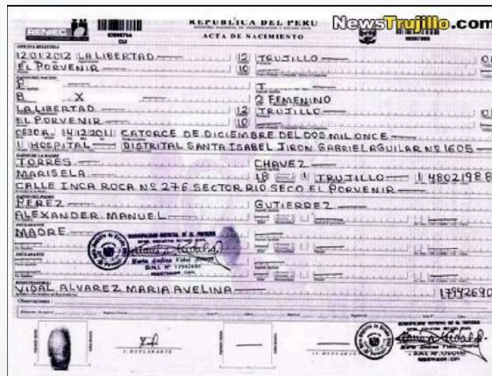
Acta de nacimiento