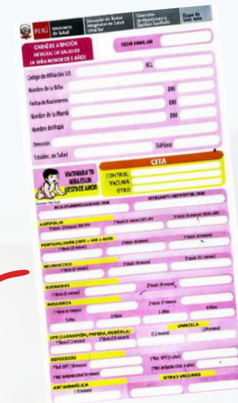
Cartilla de vacunación