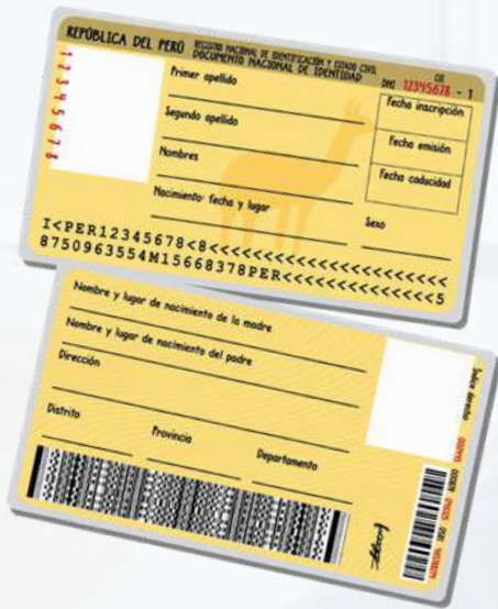
Copia de DNI simple

¡BIENVENIDOS A YAKARI! Donde el 90% del cerebro se desarrolla antes de los 5 años.