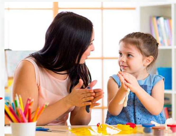
Entrevista con nuestra Psicóloga